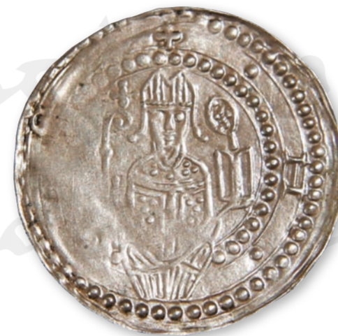
Lorschener Silberpfennig, 2. Hälfte 12. Jh.

Bis in die erste Hälfte des 13. Jahrhunderts verteidigte das Reichskloster immer wieder erfolgreich seine Unabhängigkeit. 1065 war das Kloster gezwungen, eine Burg zu errichten, die Starckenburg im benachbarten Heppenheim, um feindliche Angriffe abzuwehren. Es war das erste Mal in seiner Geschichte, dass sich das Kloster dem herrschenden König widersetzte und ihn dazu zwang, die alten Rechte für Lorsch wieder herzustellen. 1461 verpfändete Mainz das Kloster Lorsch an die Kurpfalz. Knapp ein Jahrhundert später wurde es im Zuge der Reformation durch den Kurfürsten Ottheinrich von der Pfalz aufgelöst.